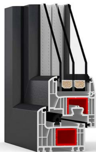
Iglo Energy Classic

*dla okna o wymiarach 1230 mm x 1480 mm wg badania w CSI w Czechach